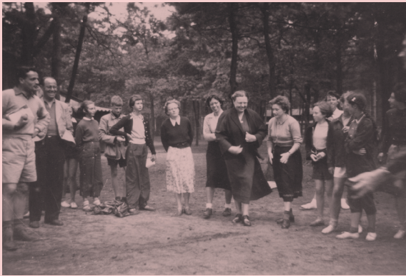
De schoolreisjes van het Maerlant-Lyceum begonnen in de jaren twintig met fietstochten naar Leiden, maar al snel lonkte het buitenland.