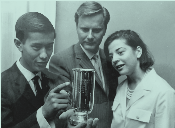
De redactie van Canto maakte een aantal malen de beste schoolkrant van Den Haag. Op de foto de uitreiking van de bijbehorende beker in 1966.