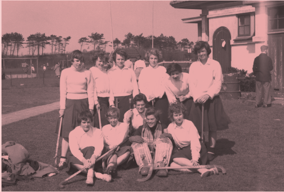
Sport en Maerlant zijn onafscheidelijk. Op de foto het dames-hockeyteam uit 1950.