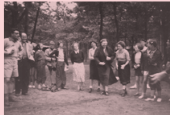
De schoolreisjes van het Maerlant-Lyceum begonnen in de jaren twintig met fietstochten naar Leiden, maar al snel lonkte het buitenland.

De school organiseert jaarlijks een groot aantal bètagereleerde activiteiten. In alle leerjaren worden regelmatig excursies georganiseerd en gastlessen gegeven. Verder kunnen leerlingen met een