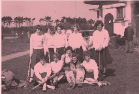
Sport en Maerlant zijn onafscheidelijk. Op de foto het dames-hockeyteam uit 1950.