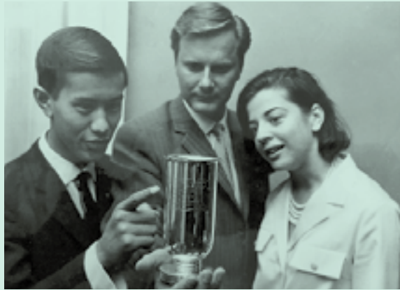
De redactie van Canto maakte een aantal malen de beste schoolkrant van Den Haag. Op de foto de uitreiking van de bijbehorende beker in 1966.